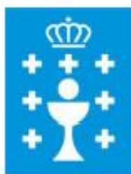
X unta de Galicia