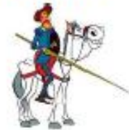
D on Quijote de la Mancha