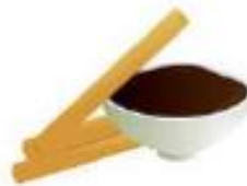
C hurros con chocolate