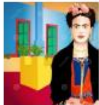
F rida Kahlo