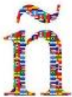
L a ñe