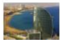
E l hotel W